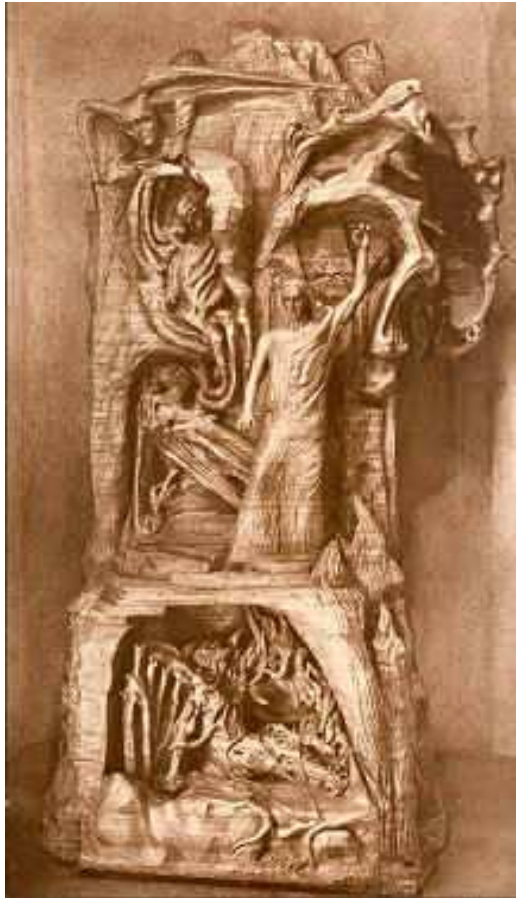
le groupe en bois hauteur : 9 m.