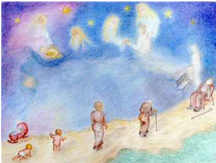
dessiné par Jacqueline

Edts : « éveil en rencontres » i.d.c.c.h. - asbl N° 42426374612 12, rue du Centre, B-5060 Auvélais –Belgique